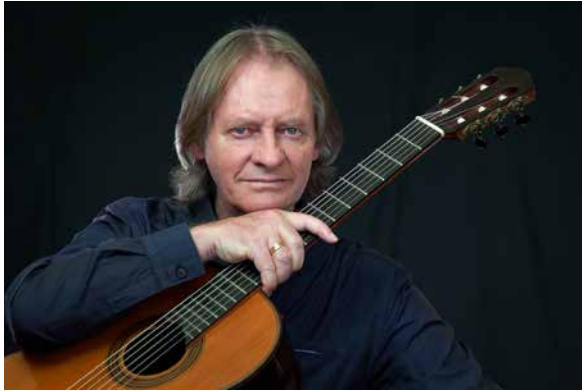
David Russell